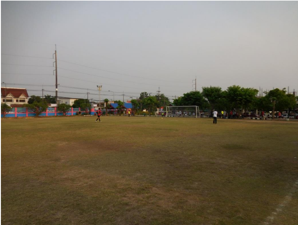
๘. สนามฟุตบอล สถานีตำรวจภูธรพังโคน หมู่ ๙