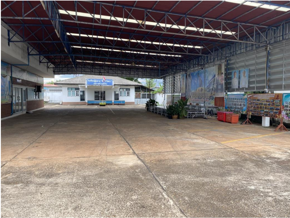
๓. ลานออกกำลั้กาย ศาลเจ้าปู่ทองแดง หมู่ ๑