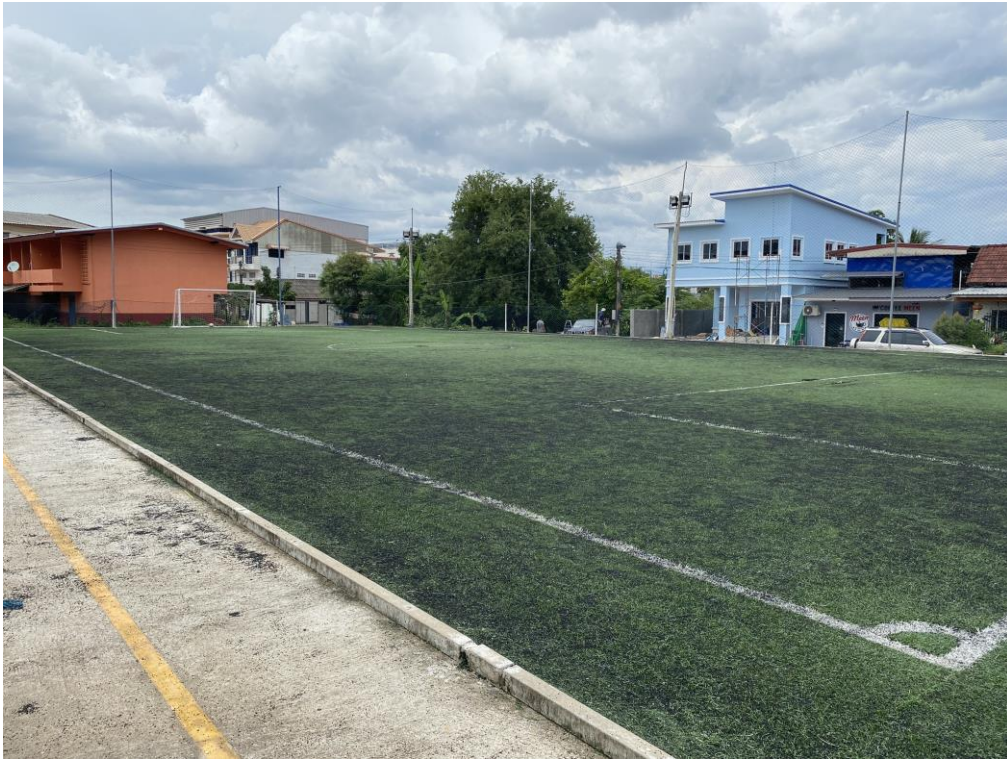
๒. ลานออกกำลังกาย ศูนย์พัฒนาคุณภาพชีวิตและส่งเสริมอาชีพผู้สูงอายุเทศบาลตำบลพังโคน หมู่ ๘